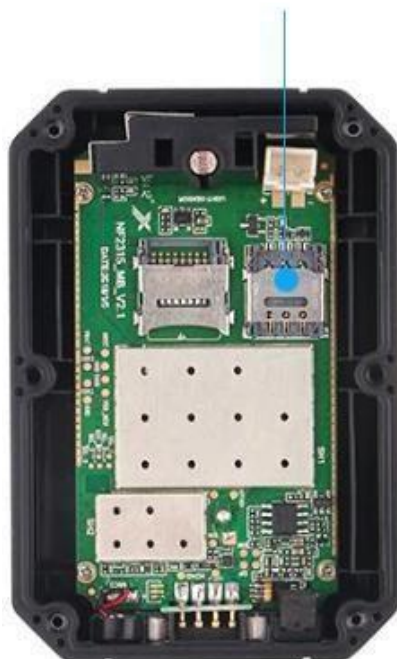
Слот для установки SIM-карты

Для установки SIM-карты раскрутите крестовой отверткой болты, откройте крышку слота SIM-карты, установите ее, закройте крышку слота и соберите устройство в обратном порядке.