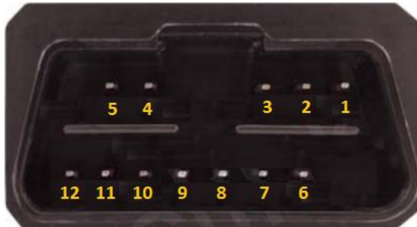
Вид разъема со стороны устройства А2